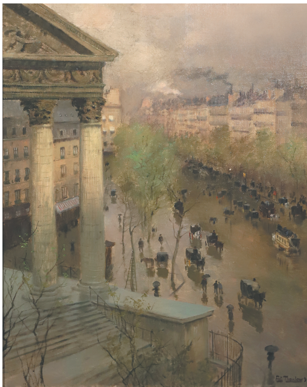
↓ Фриц Таулов. «Бульвар Мадлен в Париже».