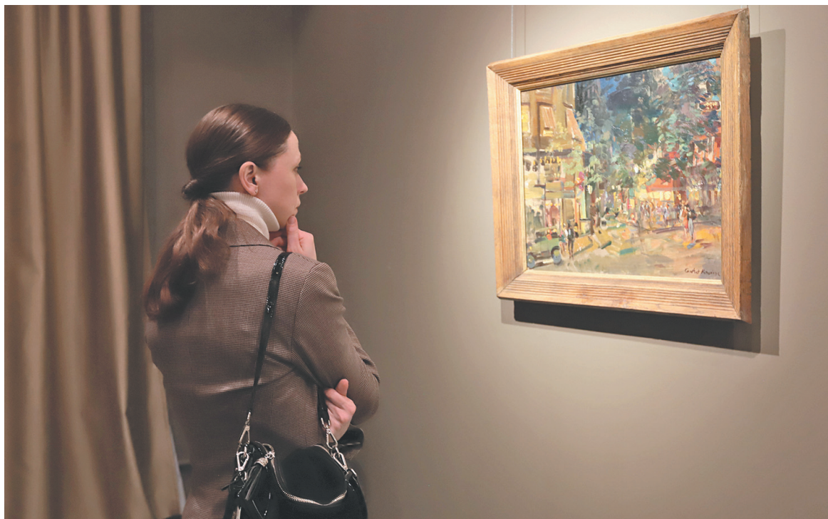
↓ На выставке.

Попасть в Париж, не выезжая из Ярославля? Pourquoi pas? Для этого всего лишь нужно отправиться в Музей зарубежного искусства, который в этом году отмечает свой первый юбилей – десятилетие. Здесь работает выставка «Париж. Впечатления».