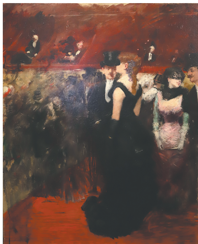
↓ Жан-Луи Форен. «Бал в парижской опере».

Многие художники писали виды Парижа с верхних этажей зданий. Это позволяло им передавать перспективу, оставляя значительную часть полотна для изображения неба. Именно так показывает бульвар Мадлен норвежец Фриц Таулов. С высокой точки в почти монохромной гамме пишет вид на зимний Нотр-Дам Альбер Марке. Эти художники не пытаются передать особенности, узнаваемые черты того или иного объекта. Они создают обобщенный вид, некий образ, который становится запоминающимся, знаковым в