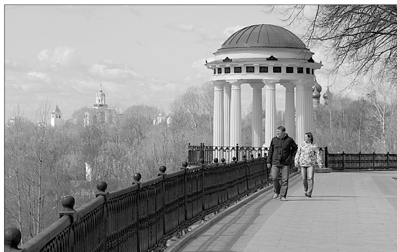
Набережная в районе Стрелки.