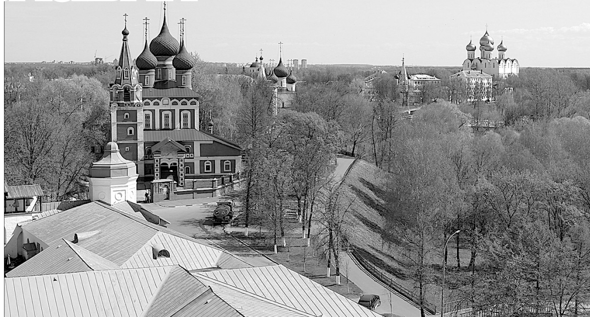
Вид на Кировский район со звонницы Спасо-Преображенского монастыря.

Городская набережная была обустроена в начале XIX века после визита Александра I в Ярославль. Императору не понравился неухоженный вид бе-