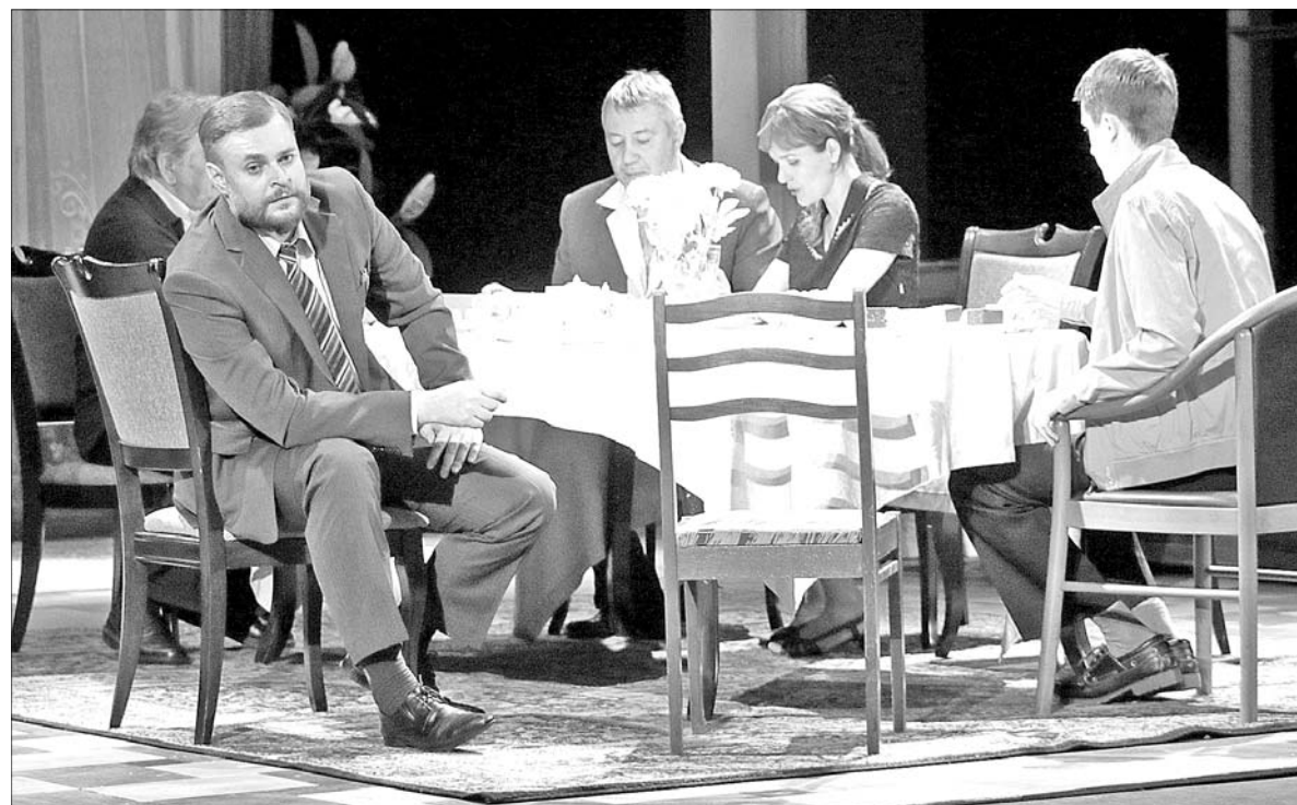
Открыл фестиваль Московский новый драматический театр.