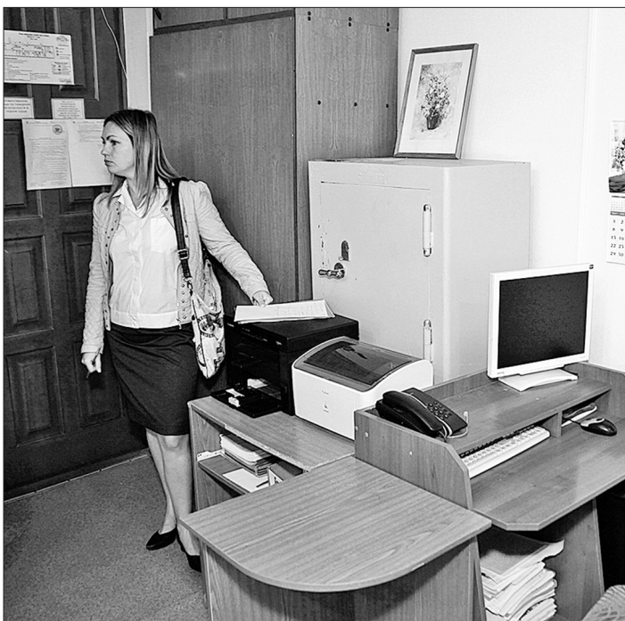
Участок № 119 практически готов.