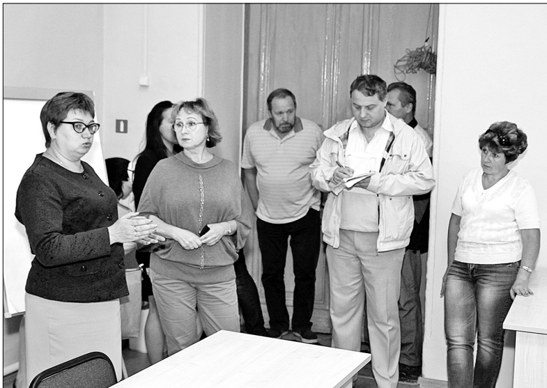
Проверка избирательного участка в академии Пастухова.

Пионером в очереди на «экзамен» стал избирательный участок № 117, который расположен в ЯрГУ имени Демидова. Там проверяли зал для голосования и место работы