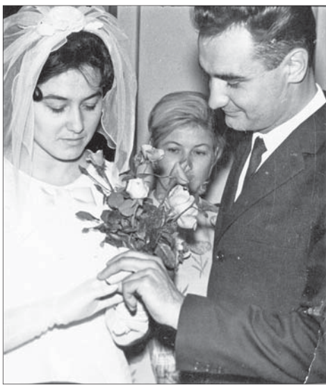
А мы такие молодые... 1967 год.