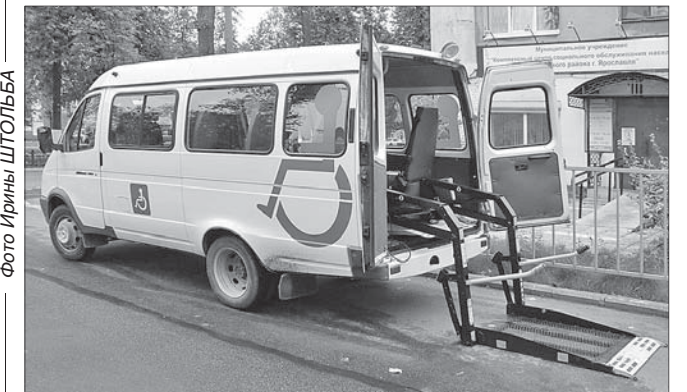
Спецавтотранспорт для инвалидов.

А съездить в поликлинику, оформить документы в госучреждениях бывает необходимо. В таких случаях поможет социальное такси.