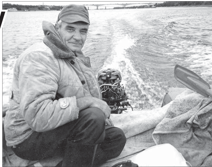
На рыбалке. 2011 год.