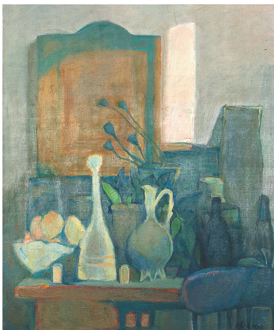
«На уголке стола». 2022 г.