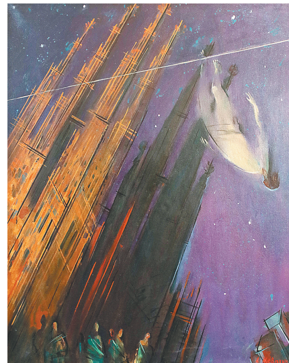
«Канатоходец» из цикла «Так говорил Заратустра». 1996 г.