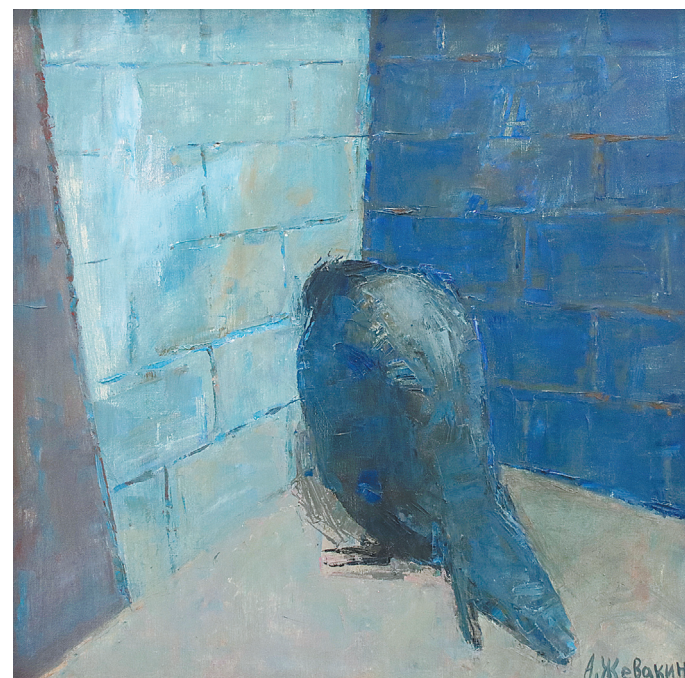
«Больной голубь». 2020 г.