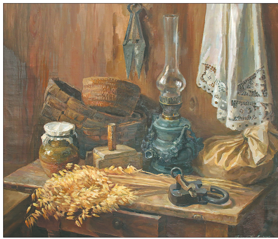
«В сенях у бабушки».

мортах — из моего деревенского дома, — вспоминает художница. — Там я получаю настоящее наслаждение, испытываю огром-