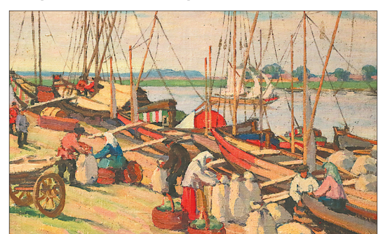
«На Волхове». А. Красотин.