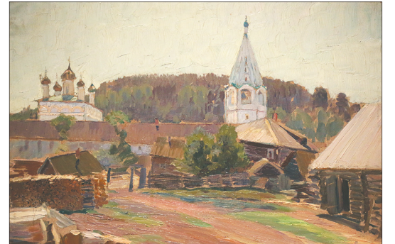
«Гороховец...». В. Переплетчиков.