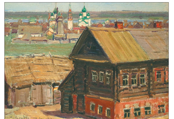
«Ярославль. Слобода Коровники». А. Васнецов.