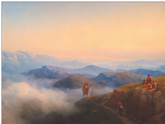
«Вид с Каранайских гор». И. Айвазовский.

Академия художеств идею поддержала. В Ярославль отправились 15 работ. На выставке можно увидеть и документы, свидетельствующие об этом факте.