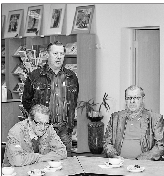
В канун Дня Победы журналисты вспоминали старших коллег.