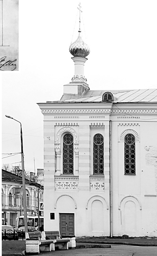
↓ Знаменская башня сейчас.