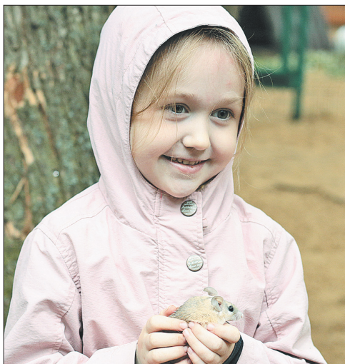
У мышонка появилась хозяйка.

В контактном зоопарке в парке «Юбилейный» раздавали игольчатых мышей и монгольских песчанок. Такие мышки есть далеко не в каждом зоопарке. В ярославском имеются. И в этом году мыши дали очень большой приплод. Но цель акции — не просто раздать лишних