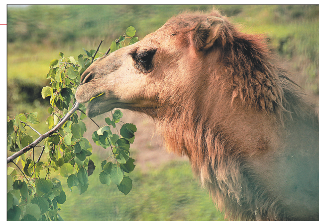
Осинка пришлась по вкусу одногорбым верблюдам.

В субботу в Ярославском зоопарке прошел День верблюда. Посетители смогли поближе познакомиться с верблюдами и их родней, а также полюбоваться на других животных.