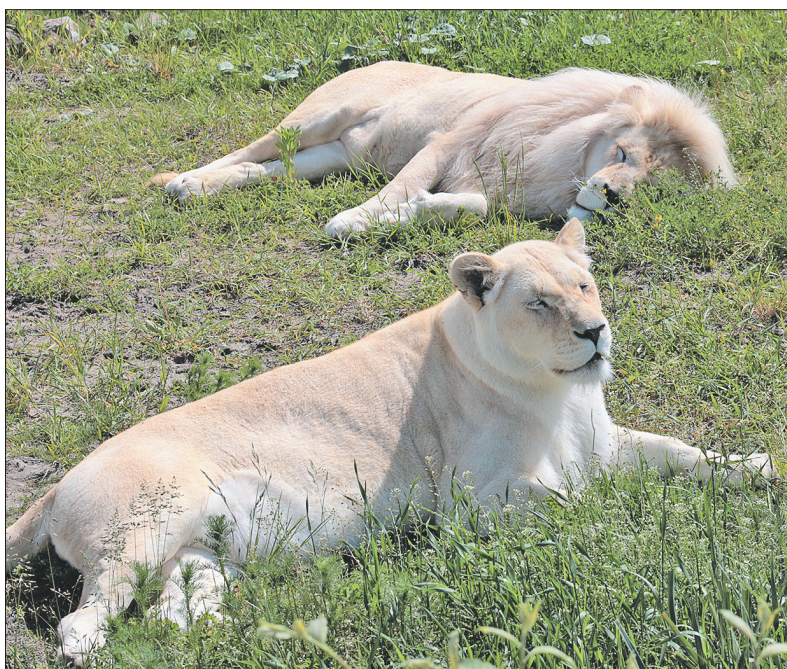
Белые львы признаны «Парой года» нашего зоопарка в 2017 г.

После интересной и познавательной экскурсии посетители зоопарка отправились наблюдать за другими животными и птицами самостоятельно.