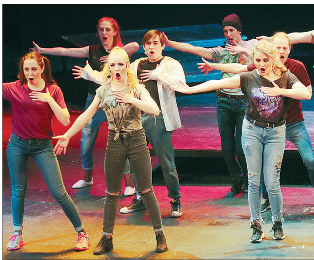
«Над пропастью во ржи».

(мастерская Сергея Соловьева). Сам прославленный кинорежиссер, автор «Ассы», «Черной розы» — эмблемы печа-