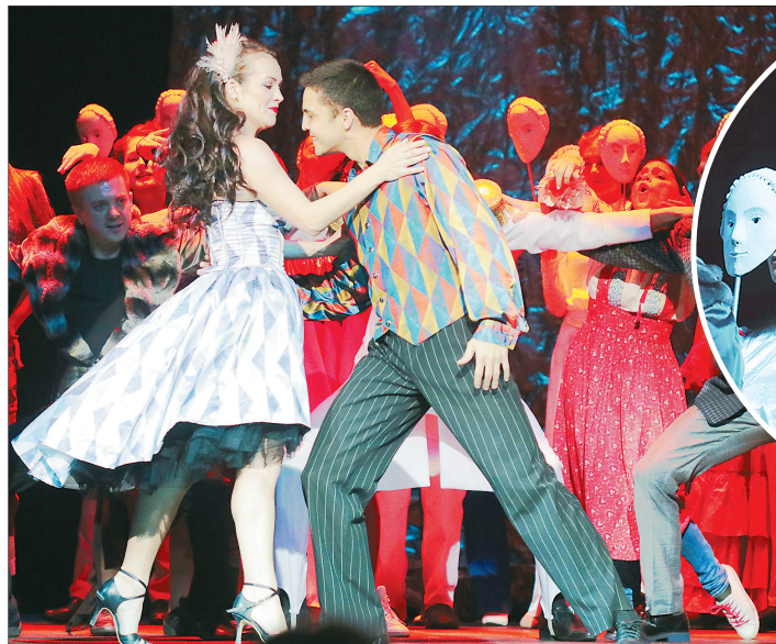
На открытии фестиваля.

Второй спектакль фестиваля — «Иванов» по пьесе Чехова — был сыгран студентами ВГИКА